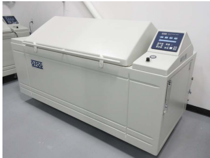
Chambre brouillard salin utilisée